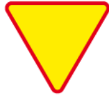
A-7 – Ustęp pierwszeństwa