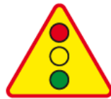
A-29 – Sygnały świetlne