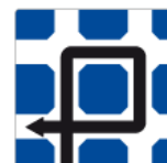
F-7 – Sposób jazdy w związku z zakazem skręcania w lewo