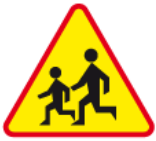
A-17 – Dzieci