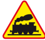
A-10 – Przejazd kolejowy bez zapor