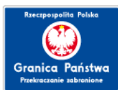
F-2 – Przekraczanie granicy zabronione