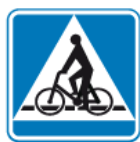
D-6a – Przejazd dla rowerzystów