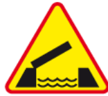
A-13 – Ruchomy most