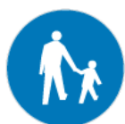
C-16 – Droga dla pieszych