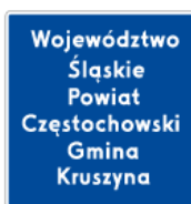
F-3 – Granica obszaru administracyjnego