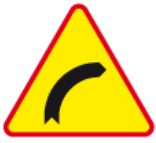
A-1 – Niebezpieczny zakręt w prawo