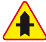
A-6a – Skrzyżowanie z drogą podporządkowaną występującą po obu stronach