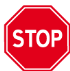
B-20 – Stop