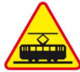
A-21 – Tramwaj