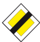
D-2 – Koniec drogi z pierwszeństwem