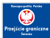
F-1 – Przejście graniczne