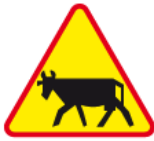
A-18a – Zwierzęta gospodarskie