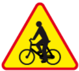
A-24 – Rowerzyści