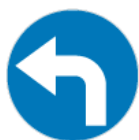
C-4 – Nakaz jazdy w lewo za znakiem