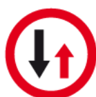
B-31 – Pierwszeństwo dla nadjeżdżających z przeciwka