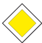
D-1 – Droga z pierwszeństwem