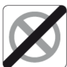
B-40 – Koniec strefy ograniczonego postoju