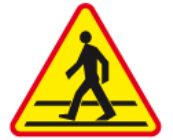
A-16 – Przejście dla pieszych