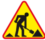
A-14 – Roboty na drodze