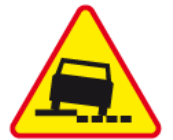
A-31 – Niebezpieczne pobocze