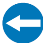
C-3 – Nakaz jazdy w lewo przed znakiem