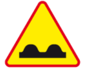
A-11 – Nierówna droga