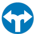
C-8 – Nakaz jazdy w prawo lub w lewo