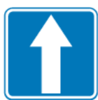
D-3 – Droga jednokierunkowa