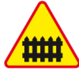
A-9 – Przejazd kolejowy z zaporami