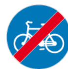
C-13a – Koniec drogi dla rowerów