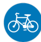
C-13 – Droga dla rowerów