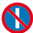
B-37 – Zakaz postoju w dni nieparzyste