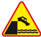
A-27 – Nabrzeże lub brzeg rzeki