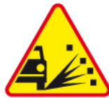
A-28 – Sypki żwir