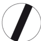
B-42 – Koniec zakazów