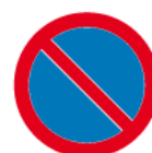
B-35 – Zakaz postoju