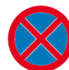
B-36 – Zakaz zatrzymywania się