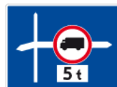
F-6 – Znak uprzedzający umieszczony przed skrzyżowaniem