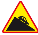
A-22 – Niebezpieczny zjazd