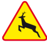
A-18b – Zwierzęta dzikie