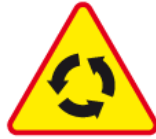
A-8 – Skrzyżowanie o ruchu okrężnym