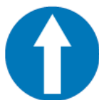
C-5 – Nakaz jazdy prosto