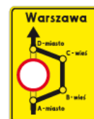
F-8 – Objazd w związku z zamknięciem drogi