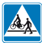
D-6b – Przejście dla pieszych i przejazd dla rowerzystów