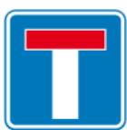
D-4a – Droga bez przejazdu