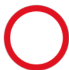
B-1 – Zakaz ruchu w obu kierunkach