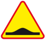
A-11a – Próg zwalniający