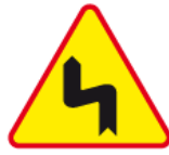
A-4 – Niebezpieczne zakręty – pierwszy w lewo