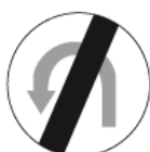
B-24 – Koniec zakazu zawracania