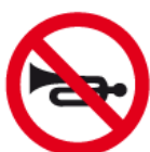
B-29 – Zakaz używania sygnałów dźwiękowych