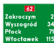
E-14 – Tablica szlaku drogowego