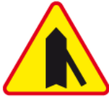
A-6d – Wlot jednokierunkowej drogi z prawej strony