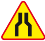
A-12a – Zwężenie jezdni dwustronne