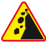
A-25 – Spadające odłamki skalne