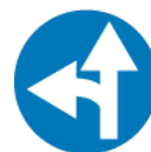
C-7 – Nakaz jazdy prosto lub w lewo