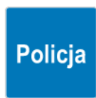
D-21a – Policja