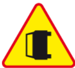
A-34 – Wypadek drogowy