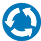
C-12 – Ruch okrężny