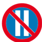
B-38 – Zakaz postoju w dni parzyste