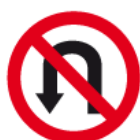
B-23 – Zakaz zawracania