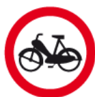
B-10 – Zakaz wjazdu motorowerów