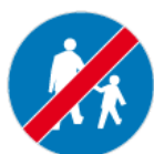
C-16a – Koniec drogi dla pieszych