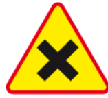
A-5 – Skrzyżowanie dróg