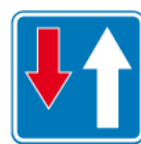
D-5 – Pierwszeństwo na zwężonym odcinku drogi