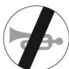
B-30 – Koniec zakazu używania sygnałów dźwiękowych