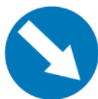
C-9 – Nakaz jazdy z prawej strony znaku