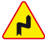
A-3 – Niebezpieczne zakręty – pierwszy w prawo