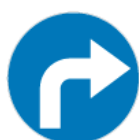
C-2 – Nakaz jazdy w prawo za znakiem