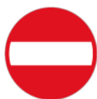
B-2 – Zakaz wjazdu