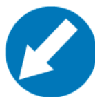
C-10 – Nakaz jazdy z lewej strony znaku