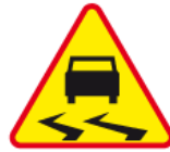
A-15 – Śliska jezdnia