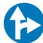
C-6 – Nakaz jazdy prosto lub w prawo