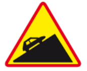
A-23 – Stromy podjazd