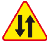
A-20 – Odcinek jezdni o ruchu dwukierunkowym