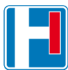
D-4b – Wjazd na drogę bez przejazdu