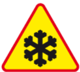
A-32 – Oszronienie jezdni