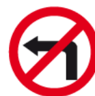
B-21 – Zakaz skręcenia w lewo