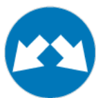
C-11 – Nakaz jazdy z prawej lub lewej strony znaku