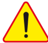
A-30 – Inne niebezpieczeństwo