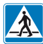
D-6 – Przejście dla pieszych