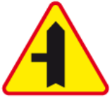
A-6c – Skrzyżowanie z drogą podporządkowaną występującą po lewej stronie