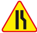
A-12b – Zwężenie jezdni prawostronne