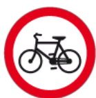
B-9 – Zakaz wjazdu rowerów