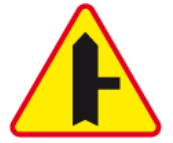
A-6b – Skrzyżowanie z drogą podporządkowaną występującą po prawej stronie